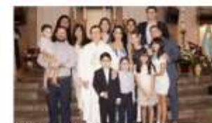
Recibe el sacramento de la Comunión