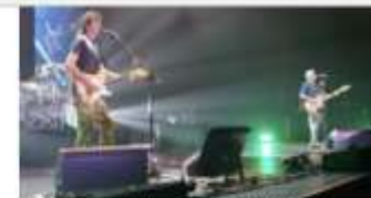
Disfrutan del pop-rock latino de Enanitos Verdes

Cabe destacar que, al término del evento, autoridades y público presente hicieron un recorrido por el vestíbulo del Teatro Juárez en donde se expuso una muestra fotográfica alusiva a la trayectoria del SAT, así como los módulos del Núcleo de Apoyo Fiscal de la Facultad de Comercio y Administración Victoria (FCAV) de la UAT.