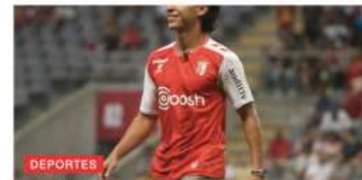
DEPORTES El SC Braga de Portugal presenta al mexicano