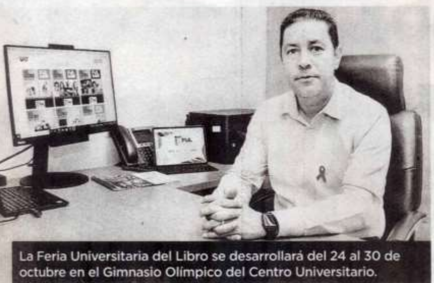
La Feria Universitaria del Libro se desarrollará del 24 al 30 de octubre en el Gimnasio Olímpico del Centro Universitario.