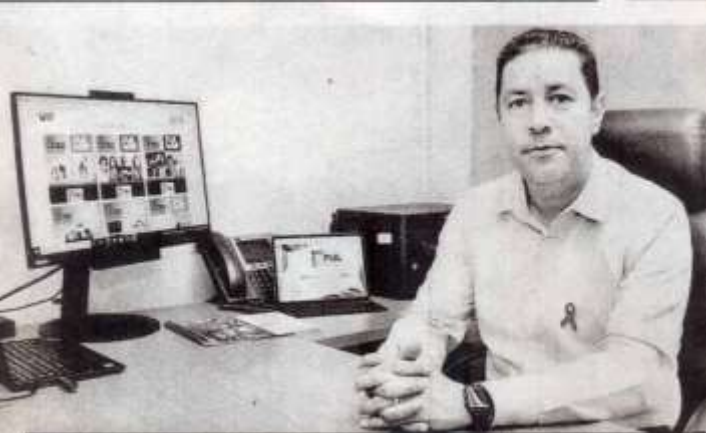
La máxima casa de estudios organiza la Feria Universitaria del Libro FUL UAT 2022.

La Universidad Autónoma de Tamaulipas (UAT) organiza la Feria Universitaria del Libro FUL UAT 2022, un espacio en el que participarán las editoriales más importantes del país y que incluirá actividades lúdicas para niños.