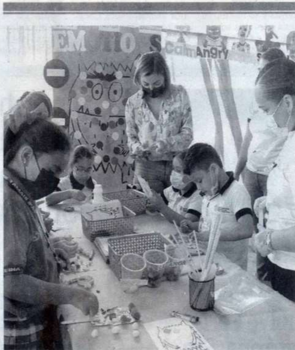
LA UAT LLEVÓ a cabo actividades en el marco del Día Mundial de la Salud Mental.