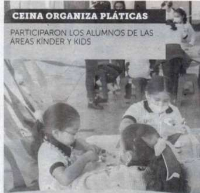
CEINA ORGANIZA PLÁTICAS

De esta manera, la UAT cumple con el objetivo de ofrecer una educación integral que propicie en el alumno el óptimo desarrollo de sus habilidades, capacidades y actitudes que favorezcan su desenvolvimiento.