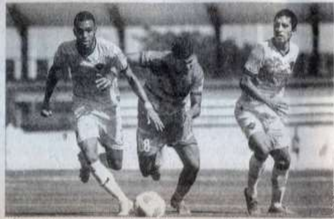
Un duelo lleno de goles se vivió el fin de semana en el Estadio Universitario