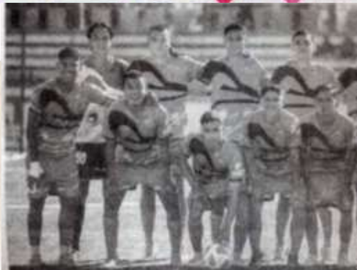
Correcaminos de Liga Premier cerró el torneo con victoria.

Con este resultado, Correcaminos concluye su participación en el presente torneo con un total de diez unidades en el Grupo 2 de la Serie A en la Liga Premier.