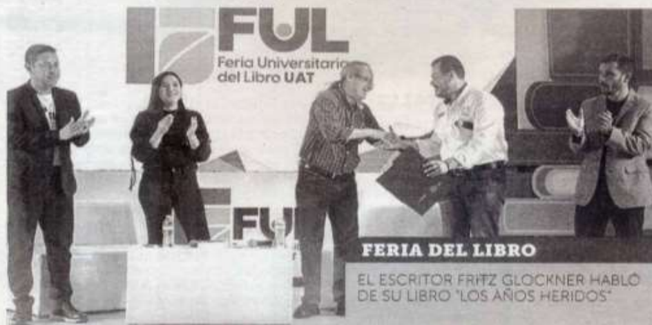
FERIA DEL LIBRO