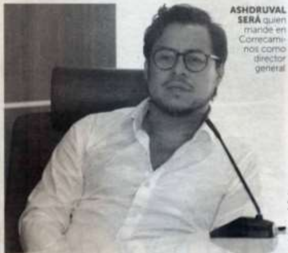
ASHDRUVAL SERÁ quien mande en Correccaminos como director general

Se espera que en próximas semanas se haga una rueda de prensa para dar a conocer el nuevo rumbo del equipo de la UAT.