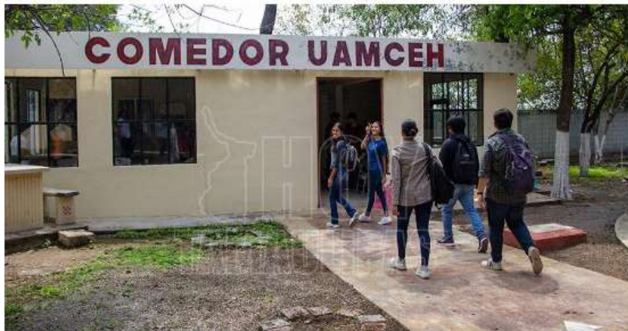
Comedor Universitario de la Unidad Académica Multidisciplinaria Ciencias, Educación y Humanidades (UAMCEH) en el Campus Victoria

Por: Marco Esquivel El Día Lunes 01 de Mayo del 2023 a las 17:55