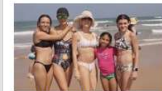
Diversión en la playa