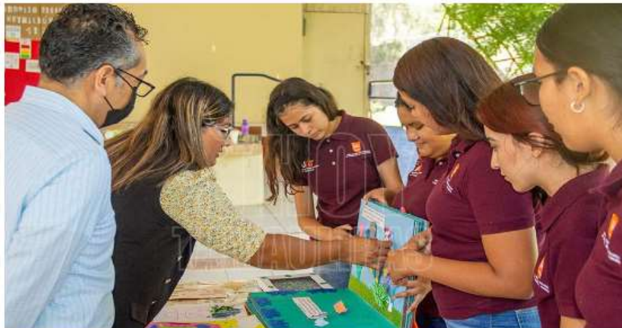
Estudiantes de la Universidad Autónoma de Tamaulipas (UAT) exploran la aplicación de materiales, recursos y herramientas didácticas innovadoras

Por: Marco Esquivel El Día Jueves 18 de Mayo del 2023 a las 18:33