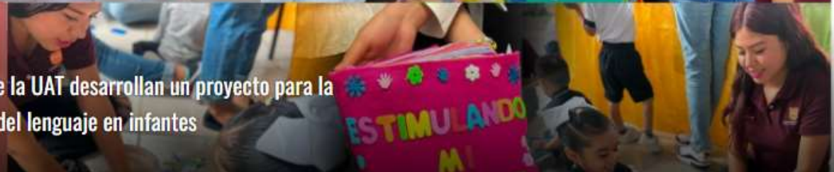
Estudiantes de la UAT desarrollan un proyecto para la estimulación del lenguaje en infantes