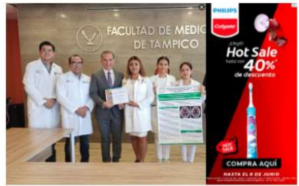
Durante dos días en cumplimiento contra 250 equipos conformados por estudiantes e investigadores de gran renombre en el estado de Querétaro

Los próximos graduados presentaron el caso clínico "Paciente Masculino con Deterioro Cognitivo y Aterosclerosis Intracraneal"