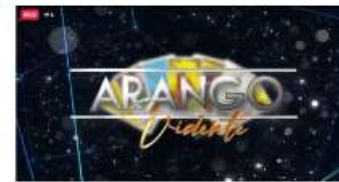
CLUSTER NEWS PRESENTA ARANGO VIDENTE