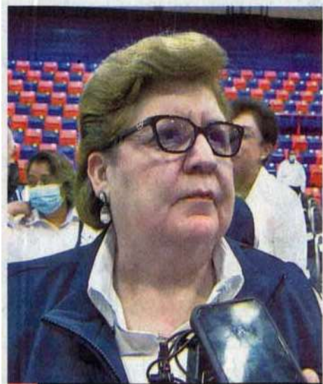
La reforma está orientada a la superación de problemáticas específicas de la región.