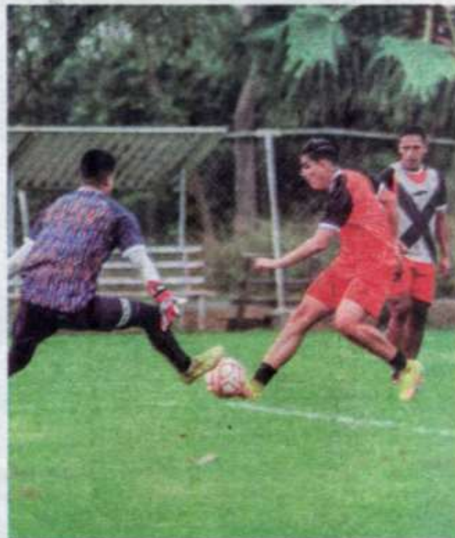
Correcaminos se reporta listo para su debut en el Clausura