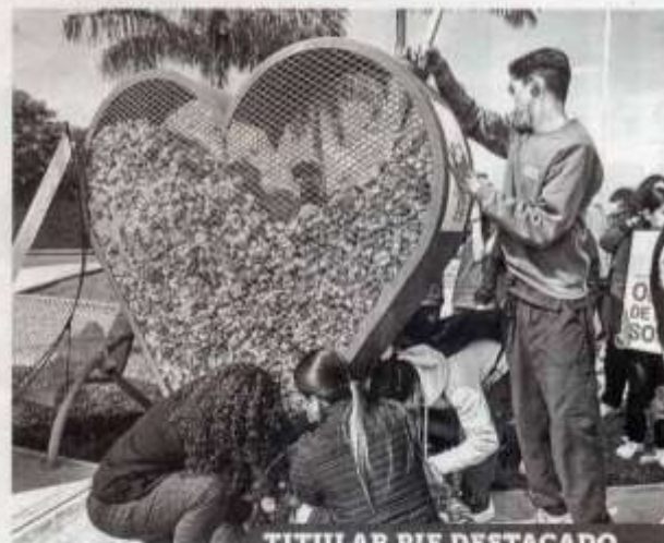
TITULAR PIE DESTACADO