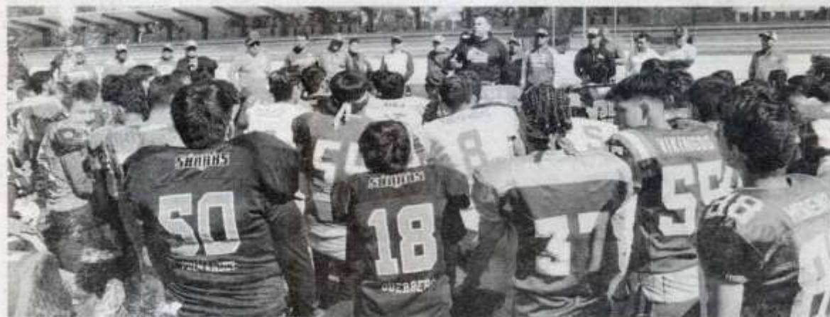
LUFAUAT REALIZÓ campamento de preparación