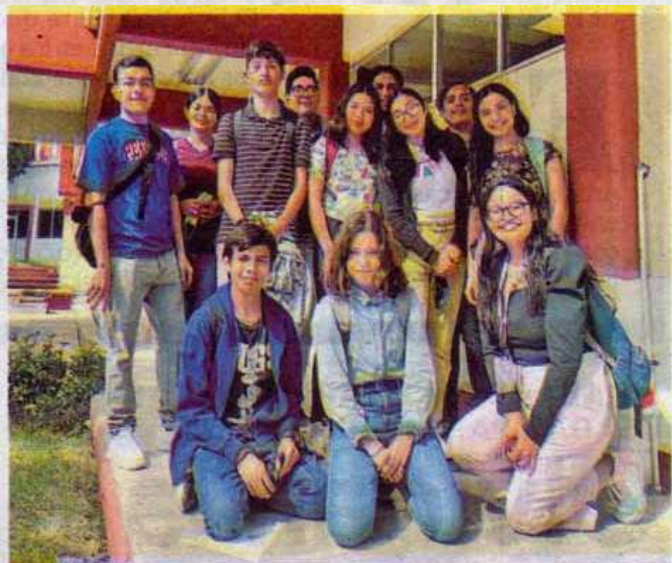
El Protocolo es una guía de cómo reaccionar frente a una posible violencia a la integridad física y psicológica.

Explicó que el Protocolo es una guía de cómo reaccionar frente a una posible violencia a la integridad física y psicológica. “Si una persona nos informa que está siendo víctima de violencia vamos a iniciar un procedimiento cuidadoso de