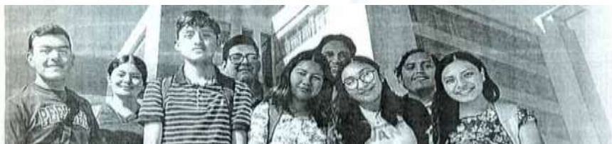
Ciudad Victoria, Tam.,

La Universidad Autónoma de Tamaulipas (UAT) trabaja en la difusión del Protocolo para la Prevención, Atención y Tratamiento de las Víctimas de Género, cuyo propósito es crear un entorno libre de actos que atenten contra los derechos de la comunidad universitaria.