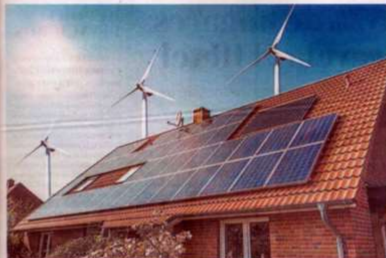
Se busca un entorno de vida más sustentable para las familias. ESPECIAL

Renovables. Vía la FADU, Comisión de Energía pretende poner al estado como pionero en usos de recursos limpios