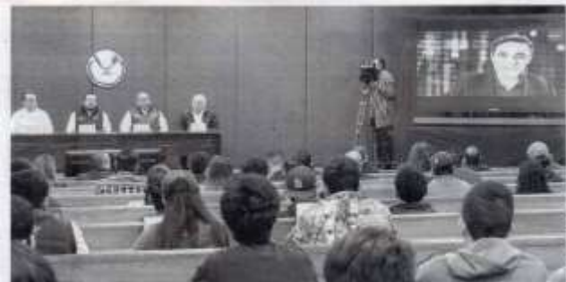
EN MATERIA de ciberseguridad destaca la ANUIES