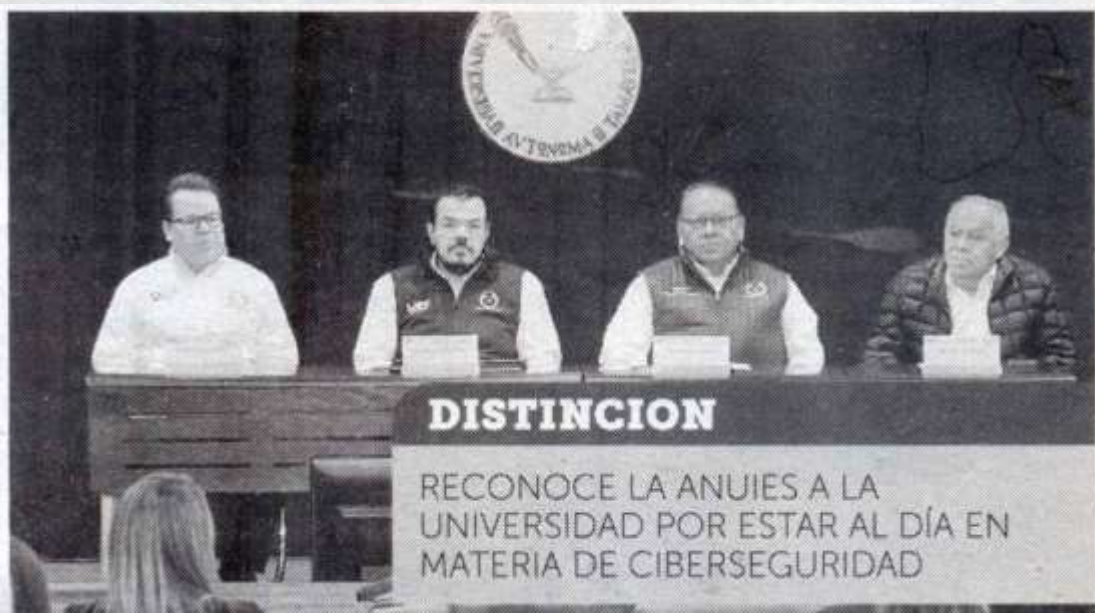
ff • Expreso-La Razon

• El evento busca hacer conciencia entre la comunidad universitaria y la sociedad en general con respecto a la ciberseguridad, además de brindar capacitación a los estudiantes que se preparan en carreras relacionadas con la tecnología.