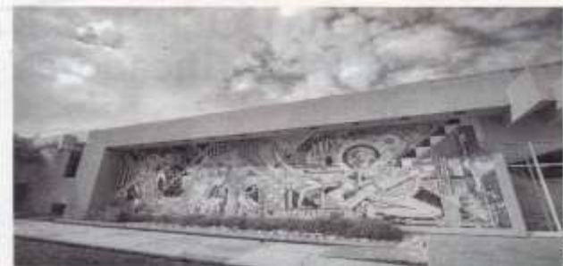
SE HA reforzado la vinculación de la FADU con instancias oficiales.

de posgrado. Detalló que hay una amplia participación de estudiantes en proyectos de investigación, y que, derivado de ese ejercicio, en los años recientes han obtenido seis premios de tesis de licenciatura. Mencionó que se trabaja con la Comisión de Energía de Tamaulipas a fin de generar proyectos vinculados a la generación de energías limpias, en donde existe la propuesta de dotar a algunos edificios con energía alternativa. El director de la FADU-UAT indicó que otro de los trabajos es con municipios del norte de Veracruz y el sur de Tamaulipas, para desarrollar una zona turística, además de un proyecto de aprovechamiento de espacios y suelos, en el que se trata de encontrar soluciones para las comunidades que padecen abasto de agua.