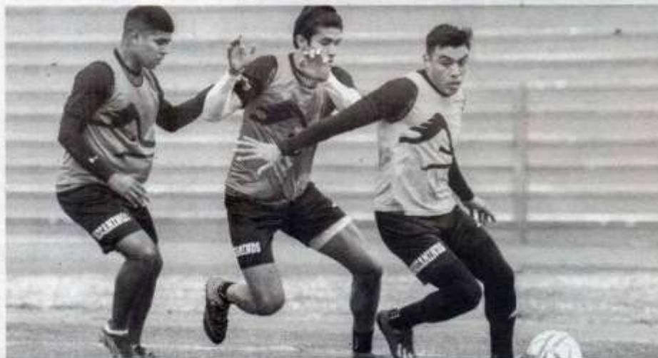
Victor Gutiérrez Meléndez • Expreso-La Razón

CORRE-CAMINOS INTENTARÁ conseguir su segunda victoria de la temporada