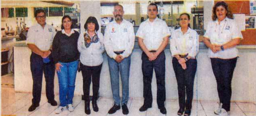
Está en proyecto la creación de la Maestría en Ciencias del Diseño, que abarcará las seis líneas de investigación.