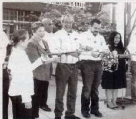
EL RECTOR dijo esta librería es resultado de la sinergia entre ambas instituciones