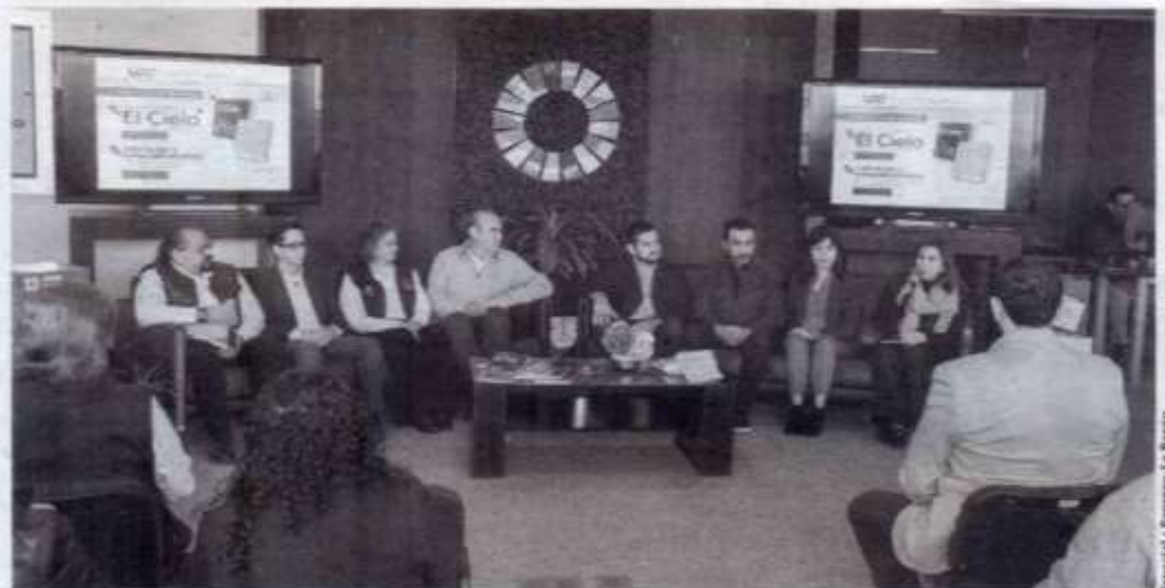
DIFUNDEN OBRAS editoriales de investigadores de la UAT