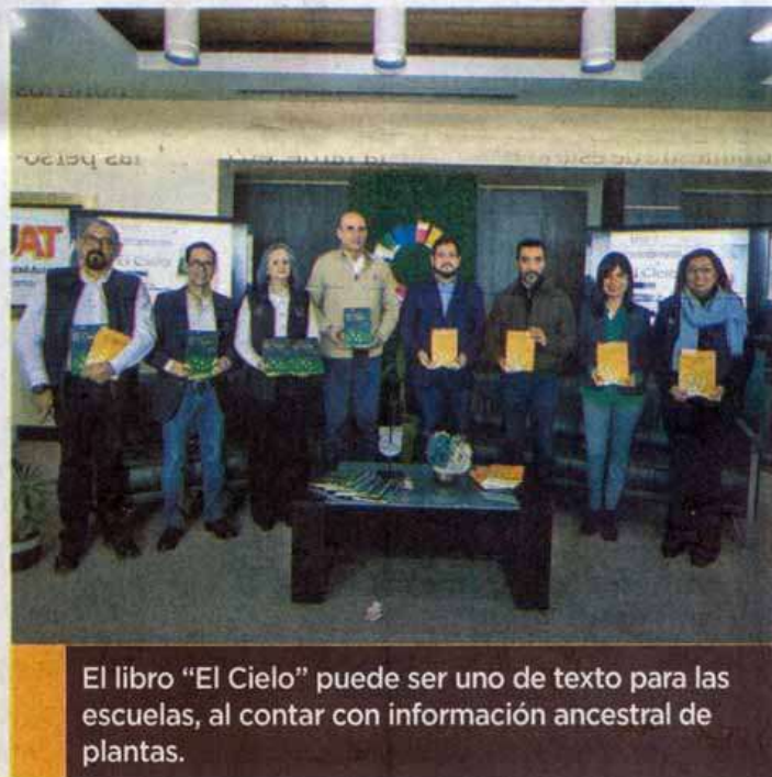
El libro "El Cielo" puede ser uno de texto para las escuelas, al contar con información ancestral de plantas.

En sus comentarios sobre las obras, apuntó que el referente a la reserva El Cielo puede ser un libro de texto para las escuelas, pues refleja el conocimiento ancestral sobre esas plantas con el tono de la ciencia, pero de modo que puede ser comprendido, sin tener amplios conocimientos