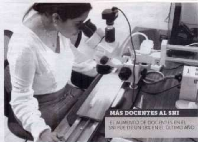
MÁS DOCENTES AL SNI EL AUMENTO DE DOCENTES EN EL SNI FUE DE UN 18% EN EL ÚLTIMO AÑO

Destacó que próximamente se abrirán convocatorias para fomentar la publicación de revistas y de