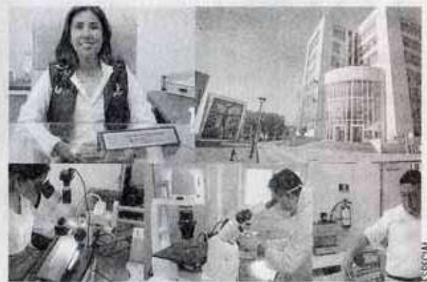
La máxima casa de estudios incrementó el número de sus docentes en el Sistema Nacional de Investigadores.

Agregó que hay grupos de investigadores de varias facultades que están trabajando proyectos de intervención social, de desarrollo tecnológico, con