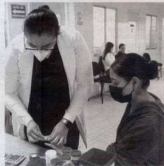
APOYAN A personal del Centro Estatal de la Transfusión Sanguínea de la Secretaría de Salud

En su oportunidad el personal del Centro Estatal de la Transfusión Sanguínea ha manifestado que la respuesta de los jóvenes de la UAT ha sido siempre muy favorable, siendo la institución que más aporta