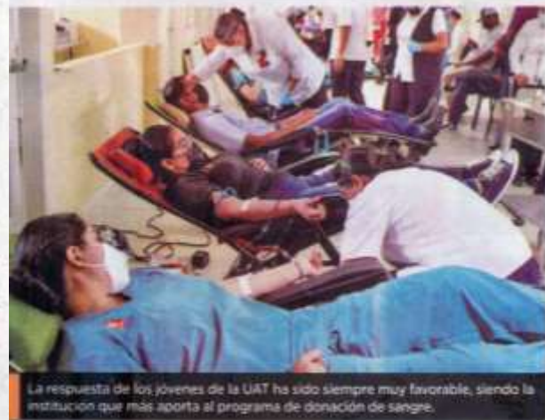
La respuesta de los jóvenes de la UAT ha sido siempre muy favorable, siendo la institución que más aporta al programa de donación de sangre.

De este modo, la UAT sigue fortaleciendo su colaboración con las instancias estatales y cobra mayor significado al tratarse de una labor que busca la sensibilidad de la comunidad universitaria y de la sociedad en general respecto a la donación altruista de sangre.