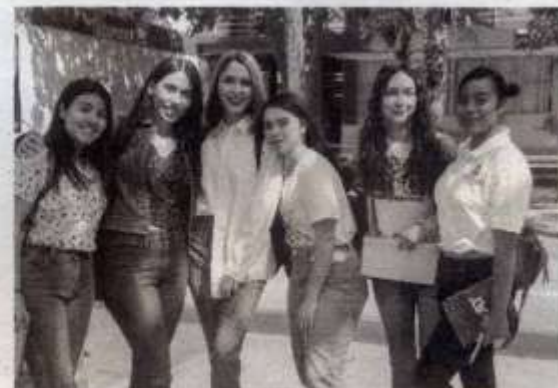
SE HA programado el evento MujerEs UAT

En la Unidad Académica Multidisciplinaria de