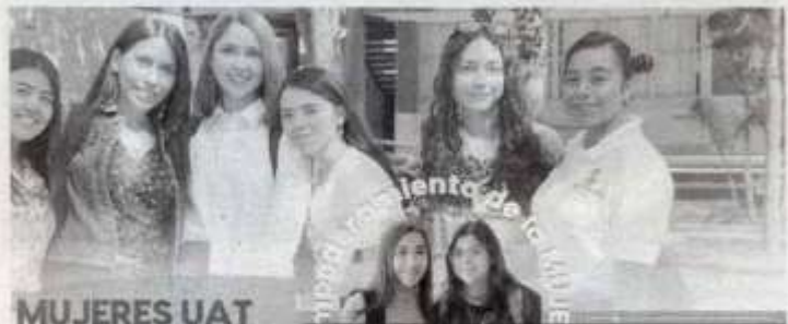
MUJERES UAT EN LA HISTORIA

REUNIRÁ LA PARTICIPACIÓN DE PROFESORAS, INVESTIGADORAS Y ESTUDIANTES EN UNA SERIE DE ACTIVIDADES EN LAS QUE SE DESTACAN LOS TEMAS DE IGUALDAD DE GÉNERO, INCLUSIÓN, EMPODERAMIENTO Y ESPACIOS LIBRES DE VIOLENCIA