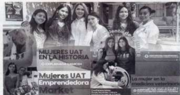
CON ACTIVIDADES reunirán la participación de profesoras, investigadoras y estudiantes