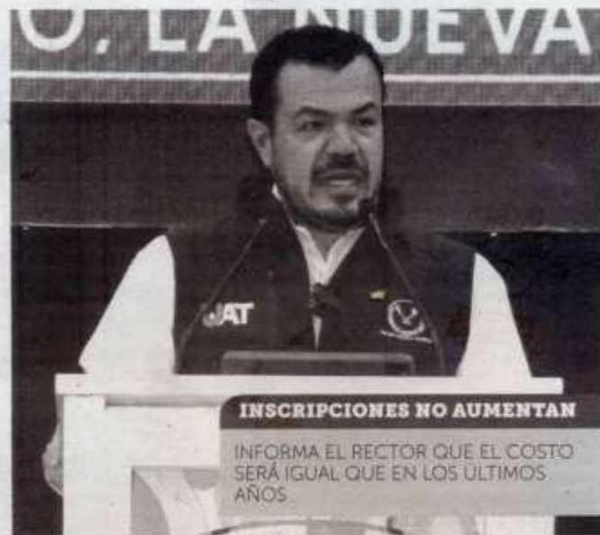
INSCRIPCIONES NO AUMENTAN

Declaró que la matrícula estudiantil de la UAT se mantuvo en alrededor de cuarenta y un mil estu-