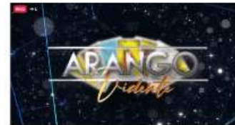
CLUSTER NEWS PRESENTA ARANGO VIDENTE