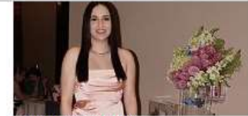
A un paso del altar

De igual manera, tratará los trabajos de investigación que desarrolla la FMVZ en áreas de sistemas de producción de bovinos, ovinos, cabras, porcinos, aves y pequeñas especies; a través de los cuales se ha trabajado en materia de virología, alimentación, producción de carne, entre otros.