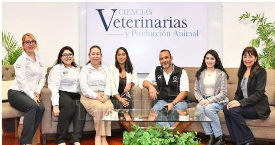
Comité de Diseño Editorial de la revista Ciencias Veterinarias y Producción Animal