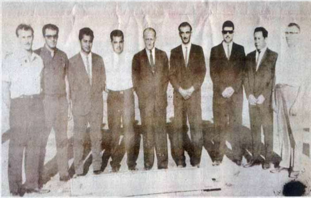
Maestros fundadores de Facultad de Veterinaria.

Aunque a principios del siglo pasado, la presencia de veterinarios en esta Capital era temporal para atender ciertas enfermedades en especies animales, al paso de los años esta profesión fue ganando adeptos entre los jóvenes de la época