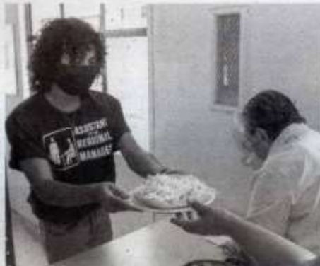
APOYAN DIF-UAT la alimentación de estudiantes de escasos recursos

Explicó que los almuerzos se sirven de 9:45 am a 11 am; mientras que el horario de comida es de 1:00 a 2:00 de la tarde; esto con el objetivo de que los estudiantes beneficiados cuenten con el tiempo suficiente para poder tomar sus alimentos y no se