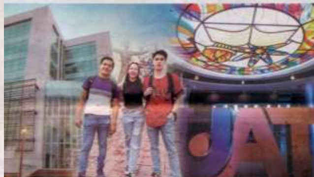
Durante los meses de junio y julio se realizarán capacitaciones masivas a todo el personal docente.