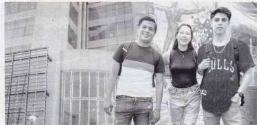
Staff - Expreso-La Razon

VICERRECTORÍA DE CALIDAD, BELLEZA, PROBIIDAD