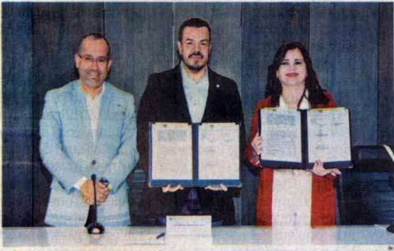
La firma del acuerdo se llevó a cabo en la sala de juntas del Centro de Gestión del Conocimiento.