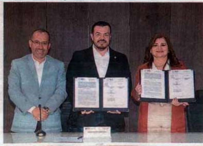
Fortalecerán acciones en beneficio de los alumnos de Comercio.

“Siempre ha existido una vinculación, sobre todo en la carrera de Contador Público, con los diferentes sectores productivos asociados a las áreas del conocimiento”, indicó el rector, y señaló que gracias a esa vinculación los estudiantes acuden a los despachos contables para fortalecer su formación universitaria, lo cual ha contribuido a que muchos de sus egresados se destaquen con importantes reconocimientos en evaluaciones nacionales. ■