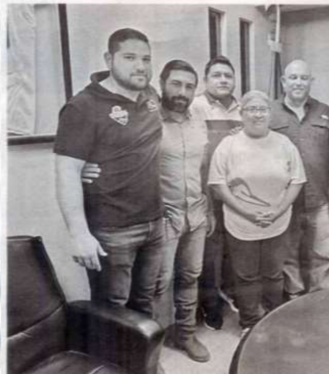
EL NUEVO líder de la LUFAUAT buscará desarrollar más la liga