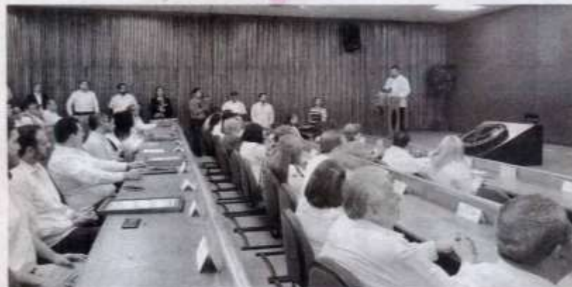
Trenta programas educativos de la máxima casa de estudios fueron evaluados y acreditados, del año 2021 a la fecha, por organismos nacionales, reconocidos ante la Secretaría de Educación Pública (SEP).

El proceso de evaluación y la posterior acreditación y reconocimiento a la calidad estuvo a cargo de organismos como los Comités Interinstitucionales para la Evaluación de la Educación Superior (Ciees) y organizaciones avaladas por el Consejo para la Acreditación de la Educación Superior (Copaes).