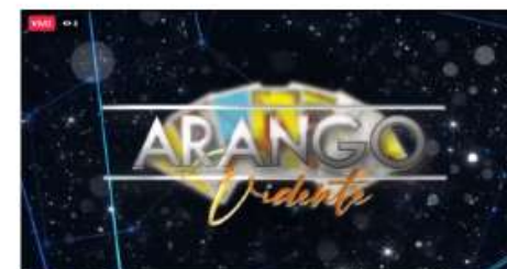
CLUSTER NEWS PRESENTA ARANGO VIDENTE