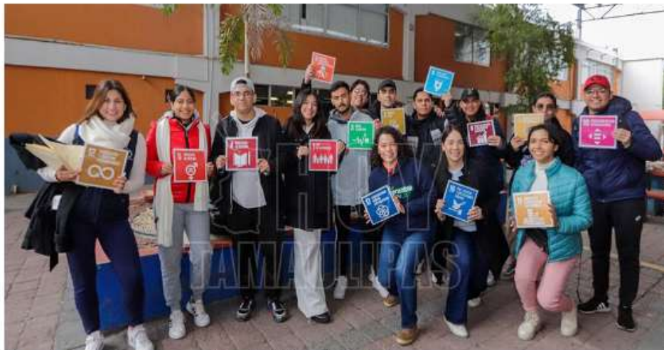
Campaña de difusión del programa "ConectadODS con tu facultad"

Por: HT Agencia El Día Lunes 06 de Febrero del 2023 a las 17:23