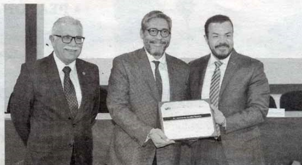
Staff - Expreso-La Razon

En ese sentido, mencionó que participarán ponentes de universidades de Argentina, Colombia, Cuba y España; investigadores de