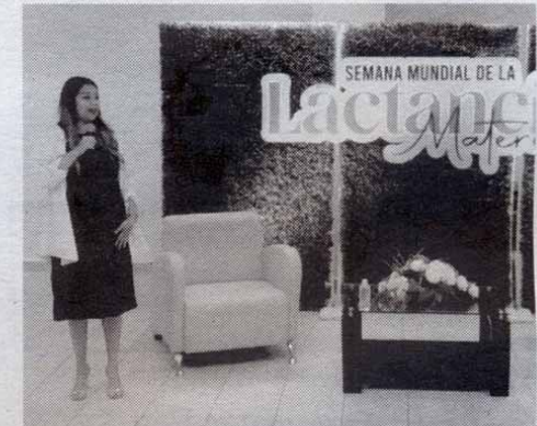
BUSCAN PROMOVER y fomentar la práctica de la lactancia materna

Sus temáticas no solo presentaron los desafíos y beneficios de la lactancia materna, sino que también pusieron de relieve la necesidad de resguardar los derechos de la mujer en cuanto a este entorno vital. Los conocimientos compartidos por las expertas aportaron una perspectiva informada y ac-