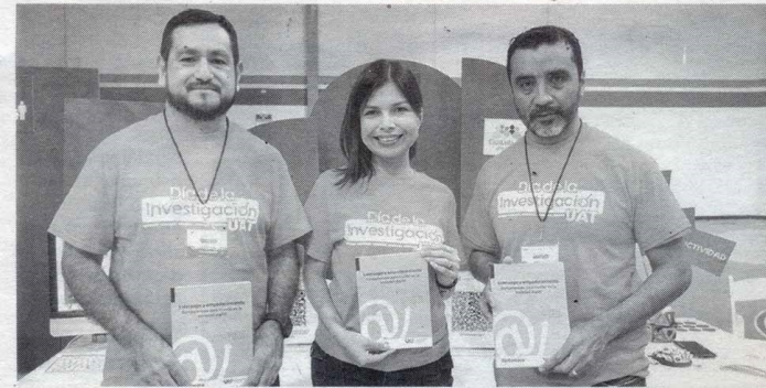
Staff - Expreso-La Razon