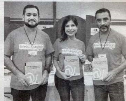
PUBLICAN LIBROS, sobre el liderazgo en la sociedad digital