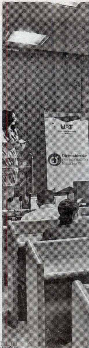
Staff • Expreso-La Razón