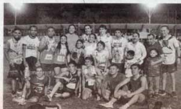
Gran participación de atletas.