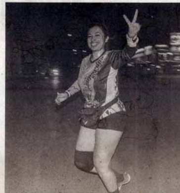
Disfrutaron la competencia.

Más de 200 medallas alusivas al evento fueron entregadas a los primeros que cruzaron la meta.