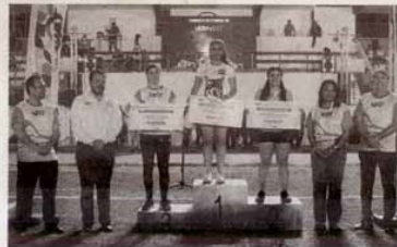
Premiaron a los mejores.