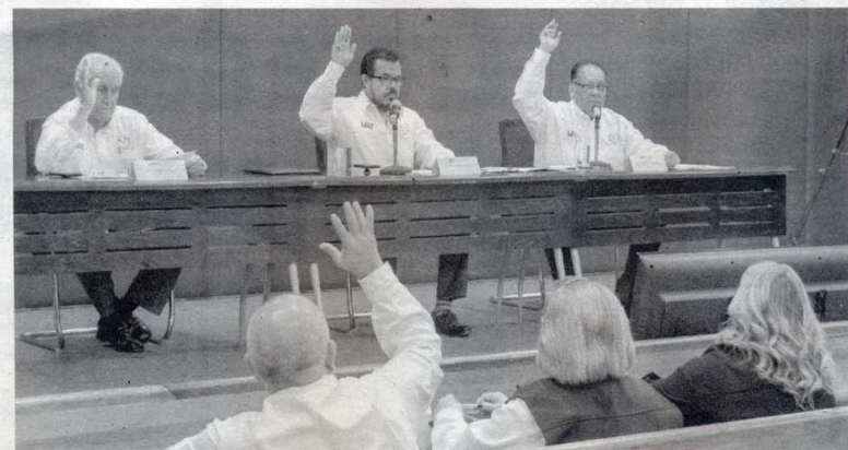
PRESIDE RECTOR, reunión de la Asamblea Universitaria