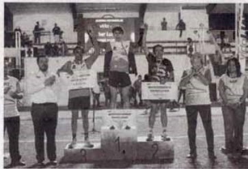
Ganadores de los 5k