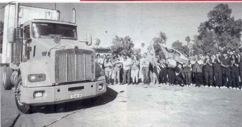
EL RECTOR dio el banderazo de salida al camión que transporta el donativo