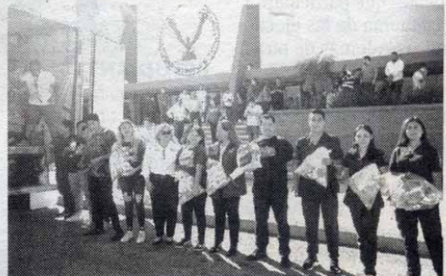
EL DESTINO final de este donativo será la Universidad Autónoma de Guerrero

El destino final de este donativo será la Universidad Autónoma de Guerrero, cuyas autoridades se encargarán de distribuir estos recursos a las familias y afectados del puerto de Acapulco que requieren asistencia.