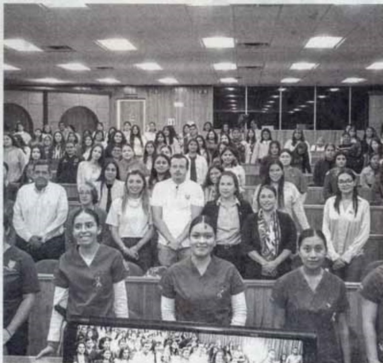
SE UNE UAT a acciones de lucha contra cáncer de mama

E n un esfuerzo por promover la concientización y la detección temprana del cáncer de mama, la Universidad Autónoma de Tamaulipas (UAT) se une a la conmemoración del Mes Rosa y el Día Mundial contra el Cáncer de Mama con una serie de actividades significativas en sus diferentes dependencias académicas y administrativas en todo el estado.