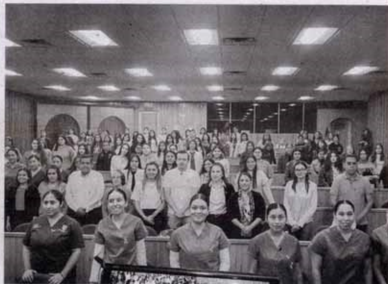
REALIZAN CONFERENCIAS, seminarios y mesas de diálogo en las que participaron expertos de la UAT

Además de este ejercicio informativo, la comu-