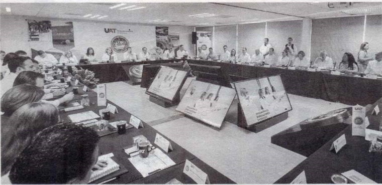
Especial • Expreso-La Razon