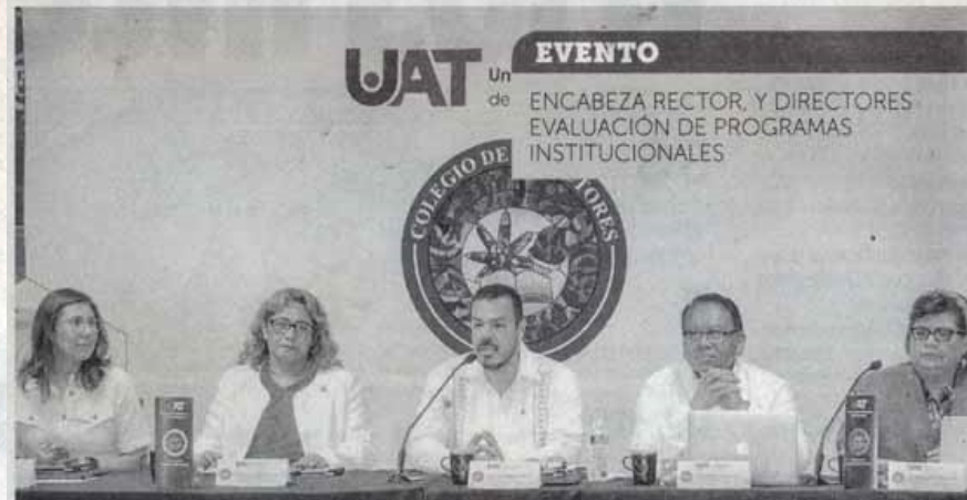
ENCABEZADOS por el Rector, evalúan en la UAT programas institucionales.