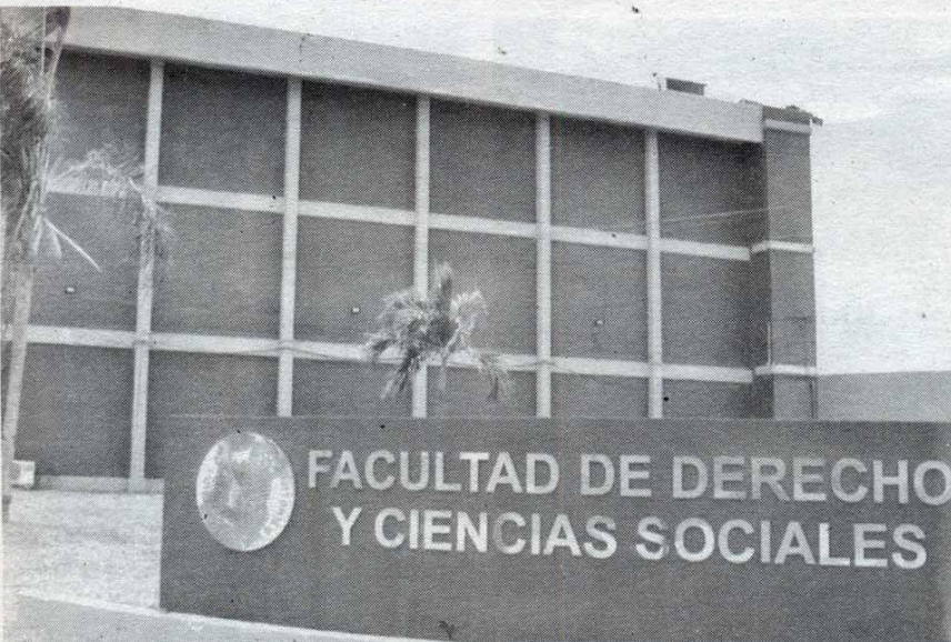
INVITAN A doctorado en Derechos Humanos