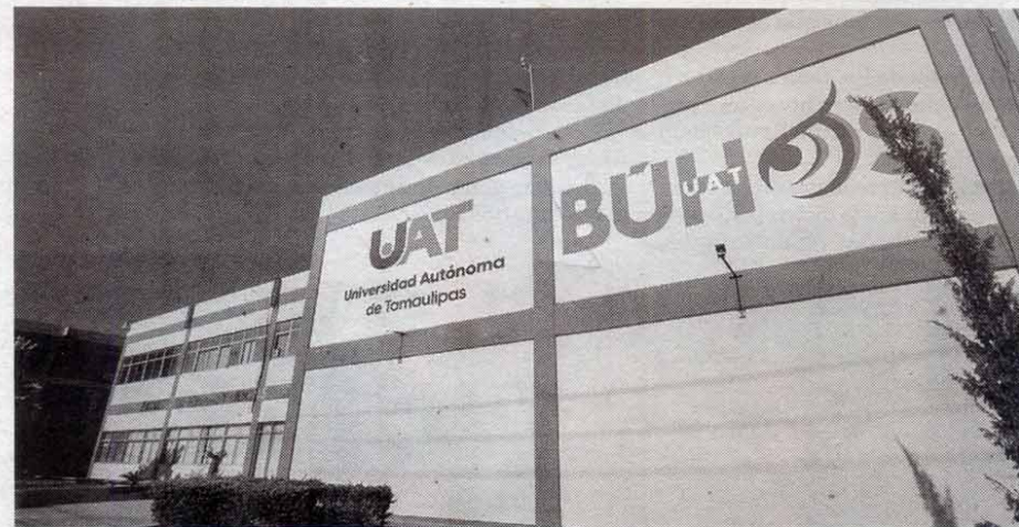
Ciudad Victoria, Tamaulipas.-

ABRE LA UAT proceso de admisión del doctorado Interinstitucional en Derechos Humanos