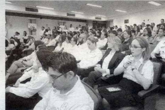
BUSCAN FORTALECER las competencias pedagógicas y disciplinares de la planta

La coordinación de esta primera edición estuvo a cargo de la Secretaría de Investigación y Posgrado y la Secretaría Académica de la UAT, con el objetivo de establecer un espacio para la transferencia de buenas prácticas de docencia innovadora a nivel institucional, fomentando la socialización de expe-