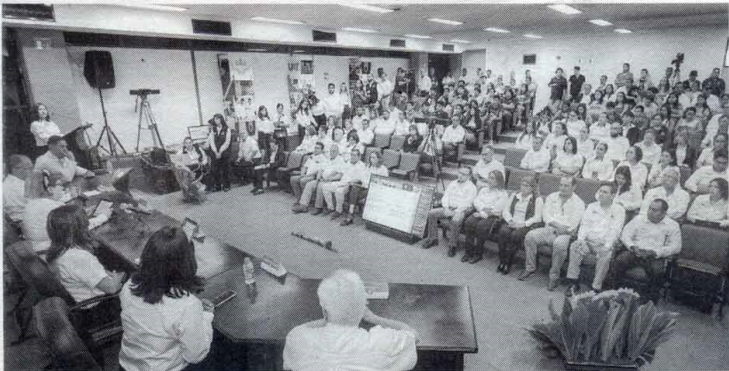
Staff - Expreso-La Razon