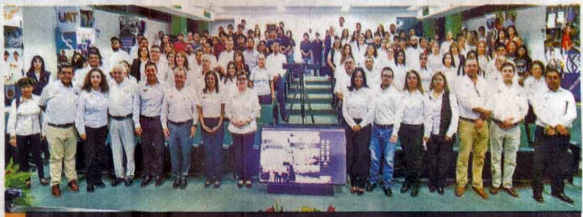
Ponentes resaltaron el propósito de inspirar y motivar a sus colegas.

Las ponencias se organizaron en seis mesas de trabajo, abordando temas cruciales como: Universidad sostenible, Enseñanza innovadora, Recursos educativos digitales, Evaluación de aprendizajes, Tutoría efectiva y Comunidad docente.