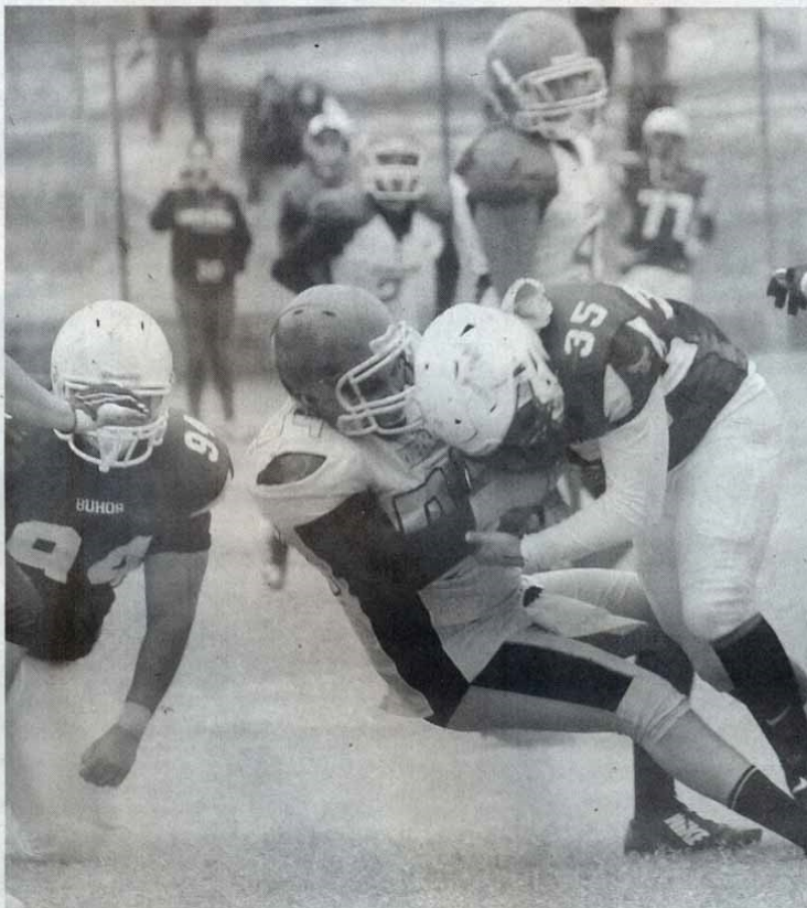
El campeón vigente de esta categoría es Búhos de la Facultad de Derecho y Ciencias Sociales Victoria.

De acuerdo a los registros del Departamento de Estadísticas de la Liga, el campeón vigente de esta categoría es Búhos de la Facultad de Derecho y Ciencias Sociales Victoria, que en final celebrada el 26 de noviembre de 2010, en el Estadio Universitario Prof. Eugenio