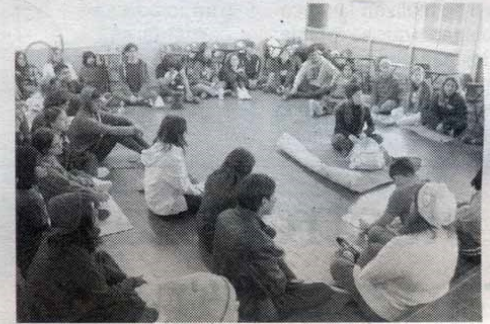
EL TEMA central fue "Psicoterapia: una visión renovada"

Se disertó también la conferencia "Terapia de