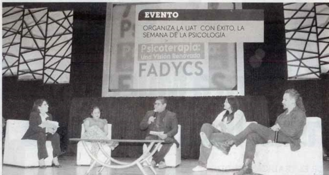
Staff • Expreso-La Razon