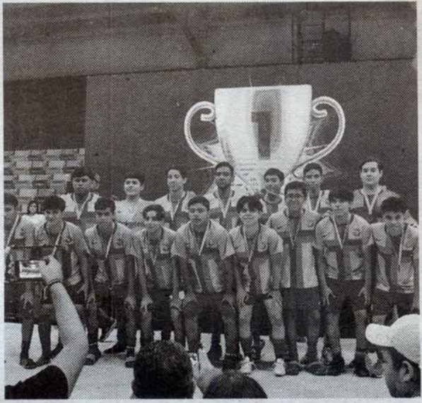
Furia Azul, digno monarca.