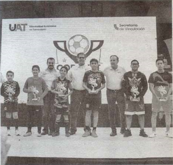
Los mejores porteros de la temporada.