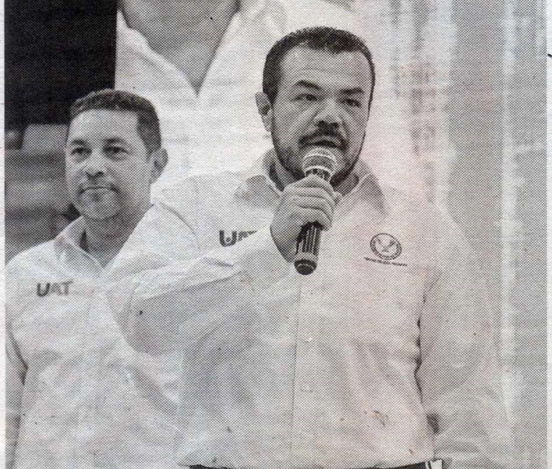
El Rector de la UAT felicitó a todos los ganadores.

Cabe señalar que, en Ciudad Victoria, la Copa UAT contó con la participación de alrededor de ciento cincuenta equipos conformados por más de mil seiscientos deportistas.