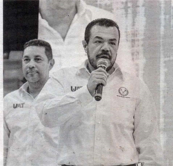
El Rector de la UAT felicitó a todos los ganadores.