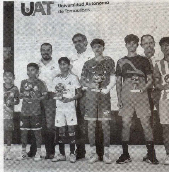
Los campeones de goleo.