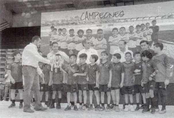
ENTREGA RECTOR, premios a ganadores de COPA UAT

Acompañaron en la ceremonia el secretario