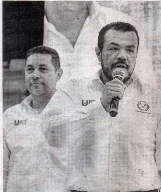
El Rector de la UAT felicitó a todos los ganadores.

Contó con la participación de alrededor de 150 equipos con más de mil seiscientos deportistas