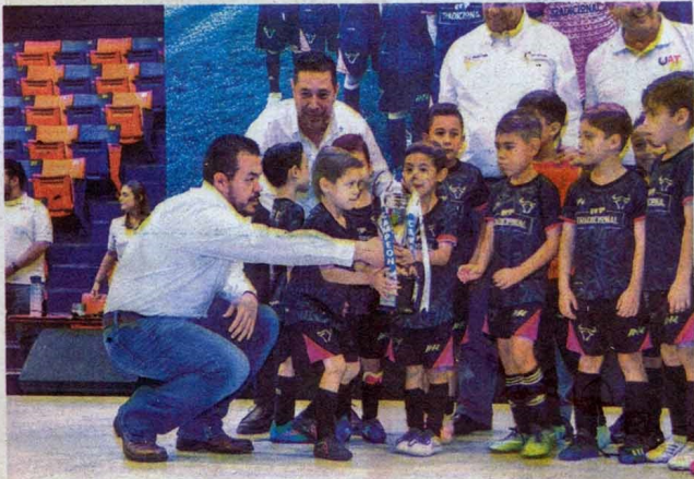
Pequeñines se tomaron la foto con el rector.