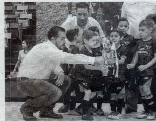
ESTE TORNEO de futbol a lo largo de 39 años ha formado a grandes futbolistas

En un colorido marco de fiesta deportiva y fami-