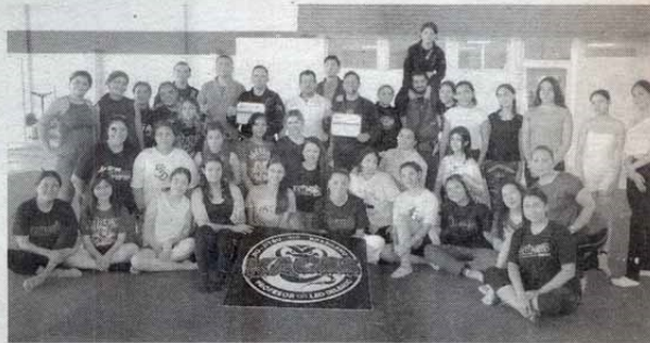
EL TALLER se realizó en instalaciones de la dirección de Deportes UAT en el Centro Universitario Victoria

Añadió que se busca empoderar a las mujeres universitarias de este plantel mediante estas técnicas y conocimientos de defensa y autocuidado, que