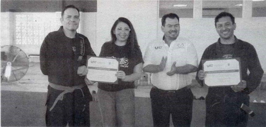
Especial • Expreso-La Razón

SE BUSCA empoderar a las universitarias mediante estas técnicas y conocimientos de defensa y autocuidado