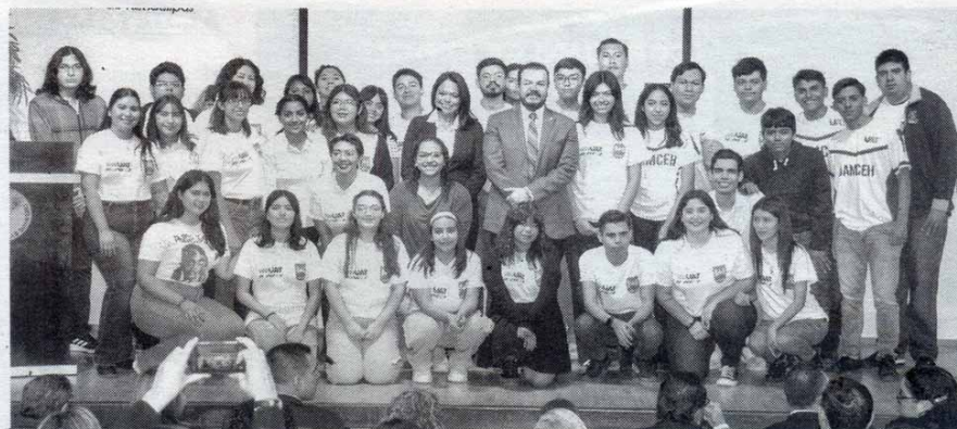
Staff - Expreso-La Razon