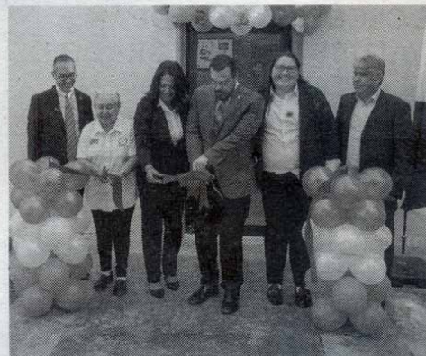
EL RECTOR inauguró la remodelación del "Comedor Alces"