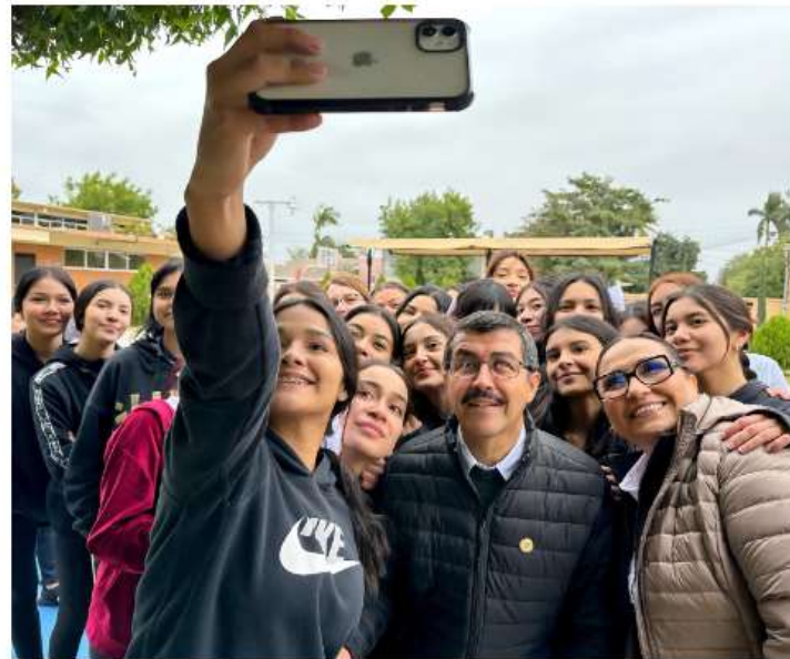
Por: Rene Ivan Aviles Garza