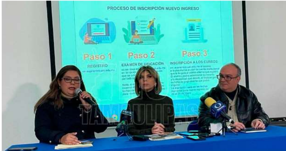
Rueda de prensa para dar a conocer los cursos del CELLAP

Por: Alberto Serna / Ciudad Victoria El Día Miércoles 17 de Enero del 2024 a las 13:00