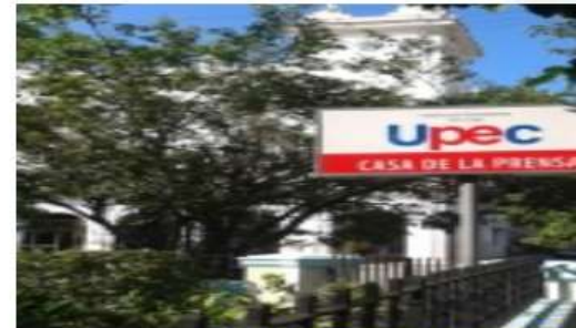
Año 2014 paseo por la Unión de Pe