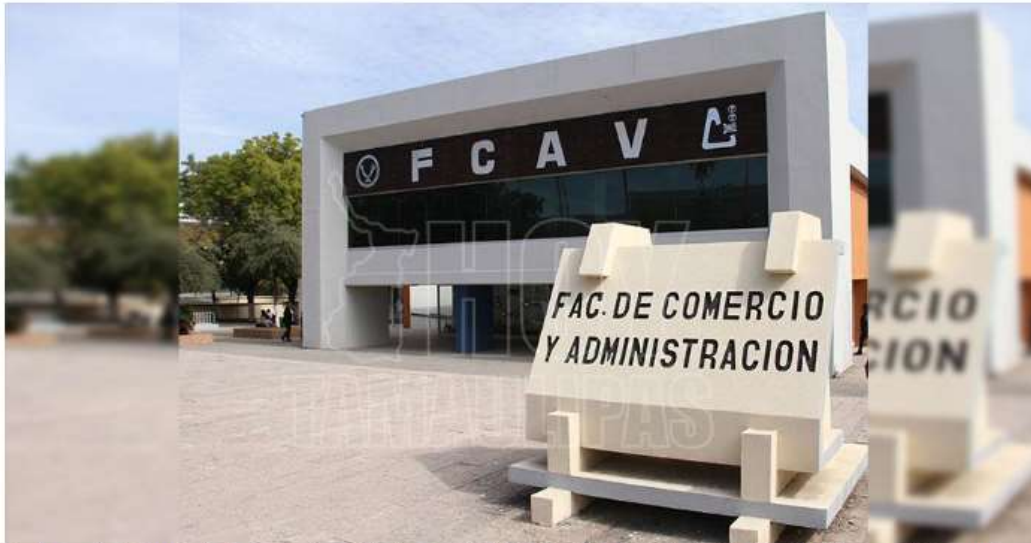
Fachada de la Facultad de Comercio y Administración Victoria (FCAV) de la Universidad Autónoma de Tamaulipas (UAT)

Por: Marco Esquivel El Día Martes 30 de Enero del 2024 a las 17:10