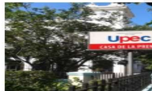
Año 2014 paseo por la Unión de